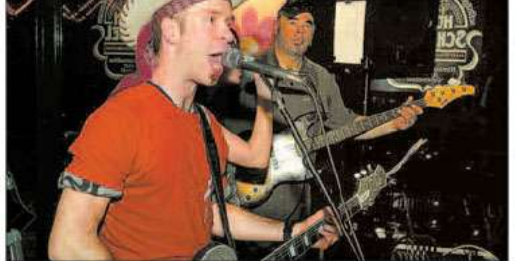
Party mit Hut: Im „Hopfenschlingel“ ging es rund.