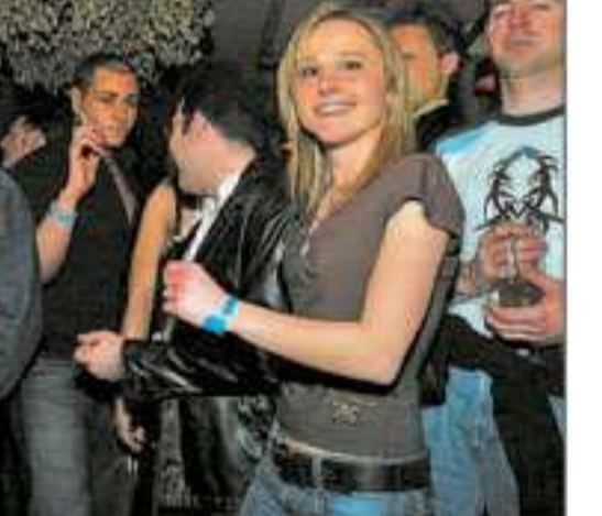
Ein Bündchen am Arm und ein nettes Lächeln – Nightgroove eben.