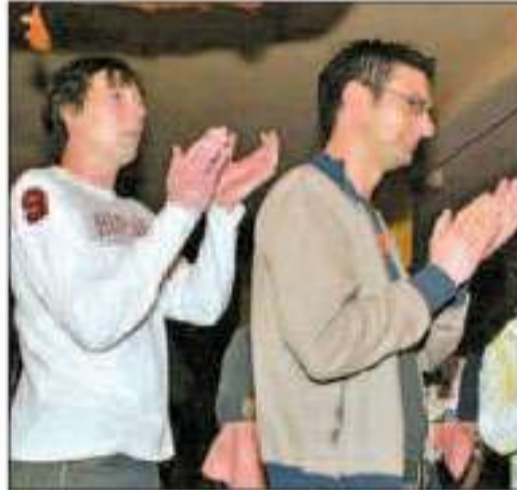
Beim Nightgroove wird geklatscht, bis es Schwielen an den Händen gibt.