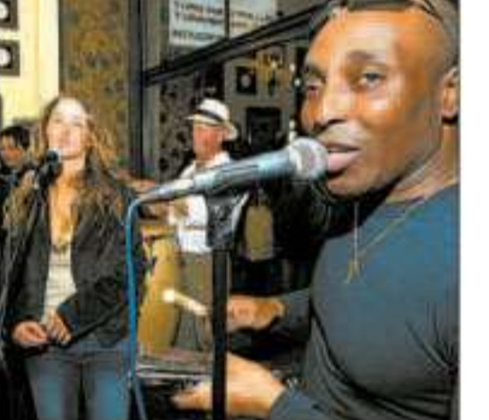
Salsa und Merengue im „Mokka“.

Mokka Hüftmusik. Schokolade geht auf die Hüften, Hosen mit modernen Schnitt-sitzen an den Hüften – und die mu-sikalischen Vorträge von „Cafe y Ti-mo“? Die gehen in die Hüften. Salsa, Merengue, Bachata und So heißen die Stilrichtungen, die das Quartett in „Mokka“ als Appetitanreger zum Kaf-fee reicht. Sie machen Appetit auf Tanzen und Popo-Wackeln. Um 22 Uhr ist im Kino nebenan Feiernabend, ein Steinwurf entfernt herrscht Feier-stunde. Hier: Jugendliche, die sich zu ihren Bushaltestellen verstreuen. Da: Jungeliebte, die sich zu exoti-schen Takten barocken – ob als rhyth-misch wippende Barock im Innern, oder als Strakentänzer vor der Bar: Die Bahnhofstraße ist fest im Griff karibischer Klangmuster.