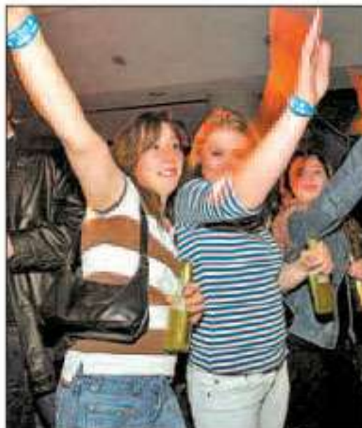
Lebensfreude im Stadtheater.