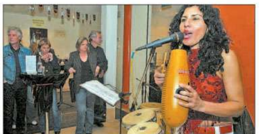
Heiße Rhythmen erwärmen das „La Strada“.

From Zero to Hero. Die Membranen der Box im „Hopfenschlingel“ vibrieren zu einem Hit der Popsängerin Sarah Connor, der sechsstelligen Verkaufszahlen erreicht hat. Das ist nur das Vorprogramm. „Die Pausenband darf jetzt aufrücken“, unterbricht der Sän-ger von „Party Blues in Btr“, der sich hier und heute für die musikalischen Sahnestücke verantwortlich fühlt, den Gesang Connors. Das Radio wird ausgeschaltet. „So, jetzt geht's weiter.“ Selbst die geschmacklose Hose des Frontmanns mit schwarz-weiß meliertem Kühmuster, sein Cowboy-Hut und seinem Strass-Stein besetzte Gitarre können jetzt nicht mehr vom Wesentlichen ablenken: von ful-minantem Party-Rock mit viel Tam-Tam, prädestiniert zum Mitsingen.