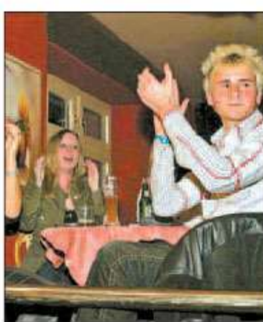
Fröhliche Gesichter zum Applaus.