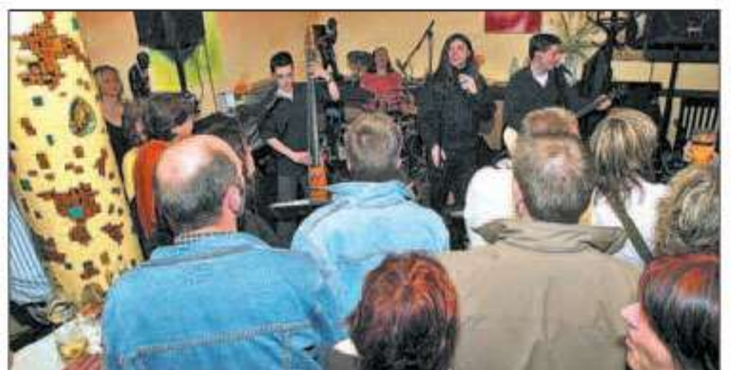
Auch im „Troc“ war es so eng wie in fast allen teilnehmenden Kneipen.