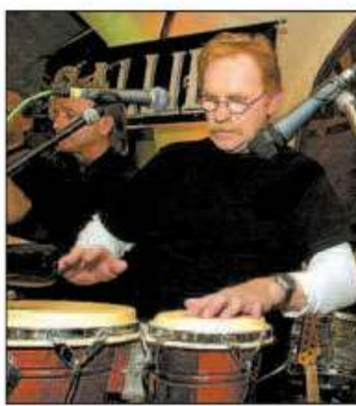
Auch im „Schlosskeller“ haben die Musiker auf die Pauke gehauen.